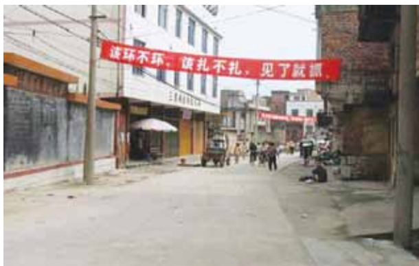
Fotoet, som er taget i forbindelse med en tidligere undersøgelse, viser et propaganda-banner med påskriften: Hvis du har fået besked på at bære en spiral, men ikke gør det, eller på at få dine æggestokke blokeret, men ikke har gjort det, vil du før eller senere blive arresteret.

En ny undersøgelse fra Population Research Institute (PRI) dokumenterer, at det forhold, at kinesiske ægtepar nu under visse omstændigheder kan få tilladelse til at få to børn, på ingen måde har sat en stopper for tvangs-aborter og tvangssterilisationer.