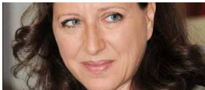
Agnès Buzyn: "Jeg er absolut modstander af at afskaffe samvittighedsreglen"

"Man kan aldrig tvinge en læge – det er en ufravigelig regel – til at gøre noget, han ikke vil gøre. Det eneste tilfælde, hvor han kan blive nødt til det, er, hvis der er fare for kvindens liv," sagde sundhedsminister Agnès Buzyn den 14. marts i år.