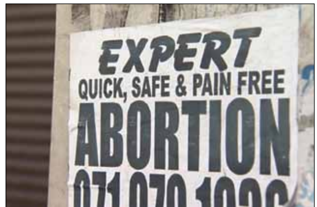
"Hurtigt sikkert og smertefrit" lokker denne plakat kenyanske kvinder med

Hertil kom, at CitizenGO havde testet Marie Stopes' hotline og konstateret, at man i mange tilfælde henviser kvinder til abort udeluk