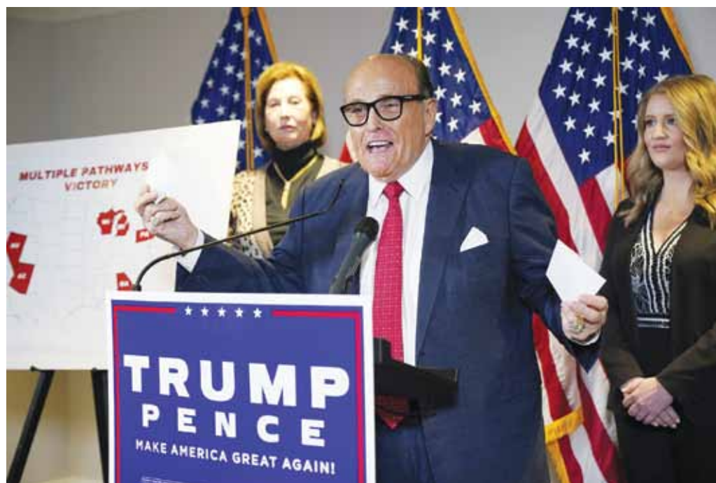
Trumps personlige advokat, New York City's forhenværende borgmester, Rudy Giuliani, taler på en pressekonference den 19. november. Til venstre: Trump-kampagnens advokat Sidney Powell. Til højre: Trumps juridiske vejleder Jenna Ellis.

F ørst og fremmest må det siges, at det ikke er helt let at blive klog på, hvordan selve valghandlingen i forbindelse med et præsidentvalg foregår i USA. Det skyldes blandt andet, at reglerne ikke er ens i alle delstater og på mange måder også adskiller sig fra dem, vi kender fra et folketingsvalg i Danmark.