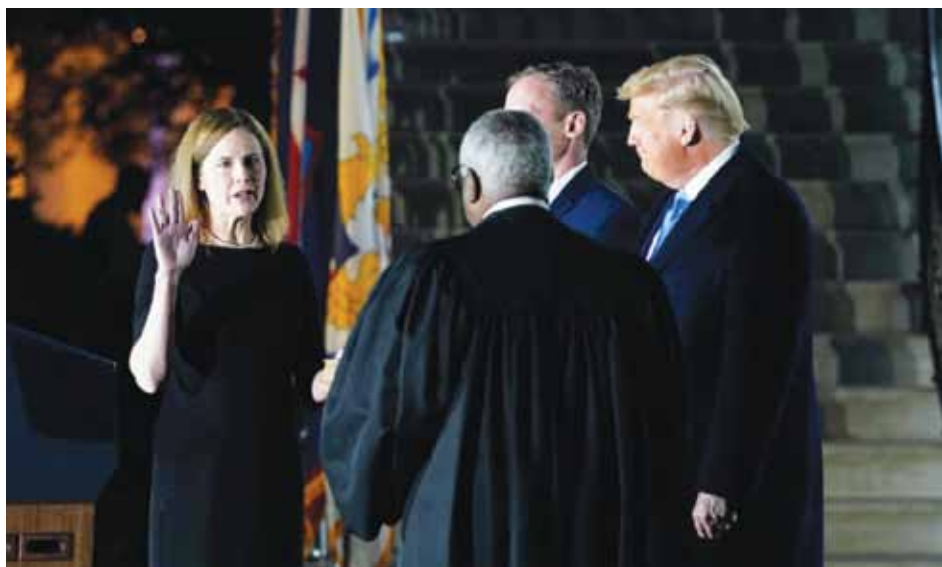
Højesteretsdommer Clarence Thomas (med ryggen til) indsætter Barrett som ny dommer i den amerikanske Højesteret, mens en synligt tilfreds præsident Trump ser til.

Mandag den 26. oktober gav et flertal i Senatet sit samtykke til at optage Amy Coney Barrett som ny dommer i Højesteret.