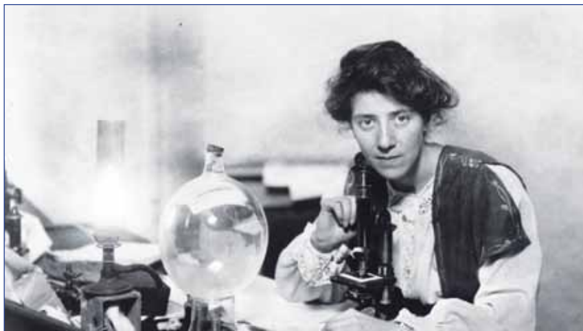
Marie Stopes (1880-1858)

Først var det Margaret Sanger, der blev taget af plakaten (se RFMnyt nr. 2, 2020). Nu er turen så kommet til "Marie Stopes International (MSI)", der for fremtiden skal hedde "MSI Reproductive Choices".