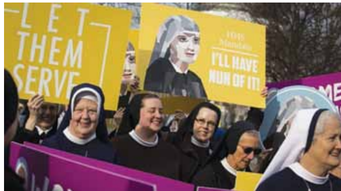
The Little Sisters of the Poor demonstrerer foran Højesteret i 2016, hvor de vandt en foreløbig sejr over Obama-administrationen