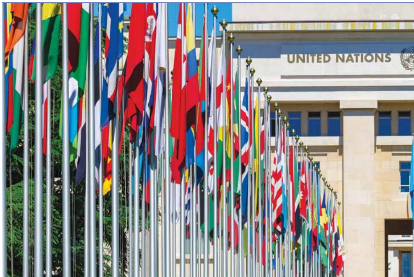
FN-bygningen i Genève