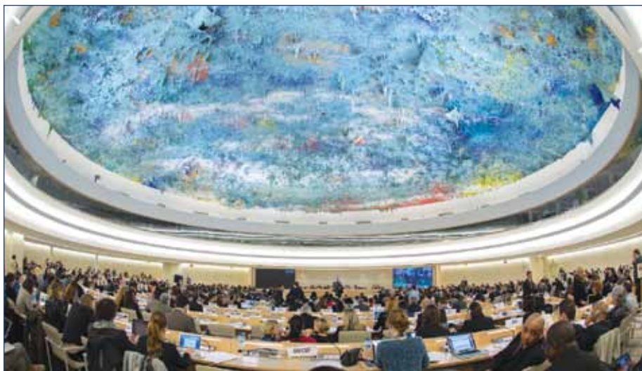
FN's Menneskerettighedsråd – en mildt sagt broget forsamling

dens ånd, i og med at "retten til livet" ophæves med et pennestrøg.