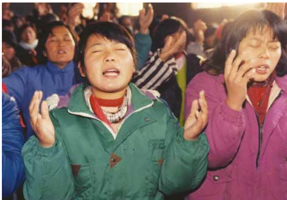
Kinesiske kristne i bøn. De systematiske forfølgelser gør det næsten umuligt for dem at praktisere deres tro.

oplyser, at både registrerede og ikke registrerede protestantiske kirker og præster individuelt og kollektivt er blevet straffet for at afholde fredelige religiøse arrangementer. De er blevet tvunget til at synge kommunistiske sange under