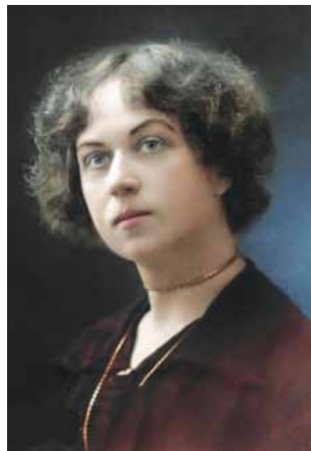
Alexandra Kollontaj (1872-1952)

"Udearbejdende mødre har ingen grund til bekymring. Kommunisterne har ingen planer om at tage børnene fra deres forældre eller om at flå spædbarnet fra moderens bryst,