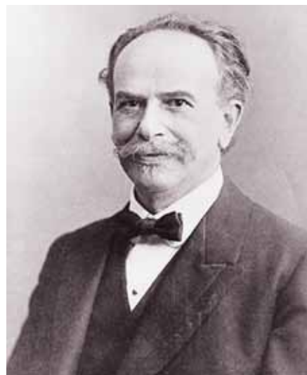
Franz Boas (1858 - 1942) – den moderne antropologis fader

Så derfor kan der ikke konkluderes på befolkningens racehygiejniske tilstand som helhed. Større variation og kompleksitet i det moderne samfund indebærer ikke nødvendigvis degeneration, tværtimod