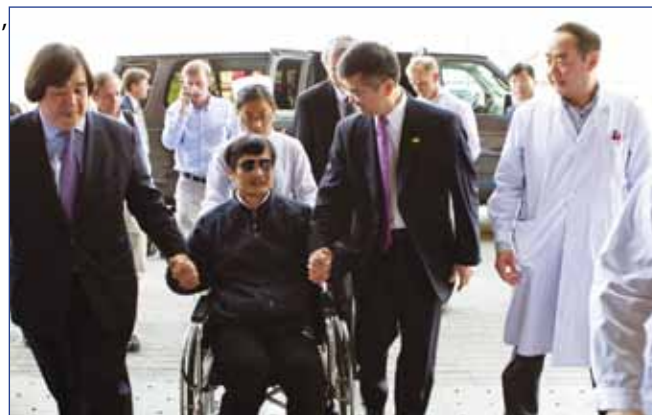
Chen Guangchen ankommer stærkt medtaget til den amerikanske ambassade i Beijing i 2012

Hvad befolkningspolitikken angår, sagde han, at selv om man er gået fra 1 til 3 børn, kan kommunistpartiet stadig tvinge enhver borger til at abortere. Hertil kommer, at partiet er i stand til at kontrollere enhver borgers bevægelser ved hjælp af moderne IT-teknologi (ansigtsgenkendelse m.m.), hvor ethvert indkøb og enhver rejse med offentlige transportmidler øjeblikkelig bliver registreret. De mange restriktioner under Covid 2-pandemien – herunder tvangsvaccinationerne i f.eks. USA og i Østrig – mener han ligeledes i betænkelig grad har vænnet os til at afstå fra vores frihedsrettigheder.