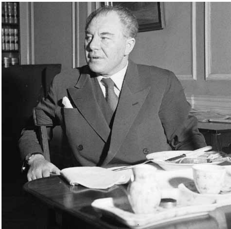
Hans Hedtoft (1903-1955 – socialdemokratisk statsminister og grundlægger af Grønlandskommissionen)

Men hvad var det så, der gik galt? Såmænd ikke andet end, at hverken "eksperter" eller bureaukrater var