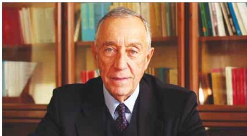
Portugals præsident Marcelo Rebelo de Sousa:

"Mennesker, som er beskæftiget i sundhedssektoren, kan ikke samtidig være dødens håndlangere"